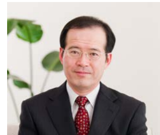
【講師プロフィール】

1959年生まれ。東京慈恵会医科大学教授 憲法学。九条の会事務局員。著書に、『自治体ポピュリズムを問う』（共著・自治体研究社）、『3・11と憲法』（共著・日本評論社）、『ほんとうに憲法「改正」していいのか？』（学習の友社）、『はじめて学ぶ日本国憲法』（大月書店）など。